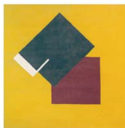
CASTELLAR 1925 - 1935