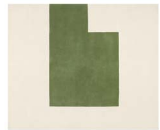
KILKENNY 1925 - 1935